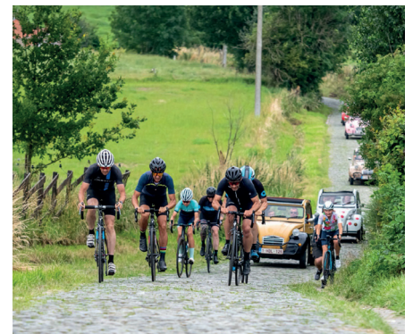
Beklimming van de Paterberg tijdens de teambuilding 'The Flandrien Trophy'